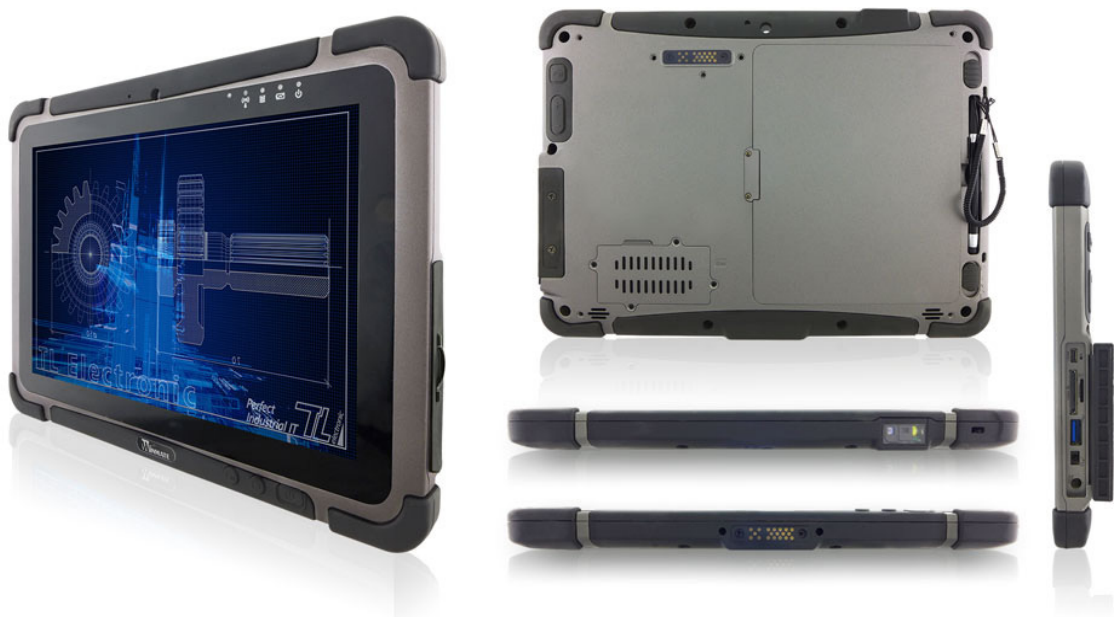
Schnittstellen und Anschlüsse

Schnittstellen und Anschlüsse befinden sich auf der rechten und der Unterseite.