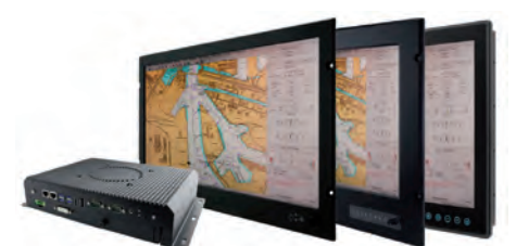
Marine Computing, zertifiziert für die Schifffahrtsindustrie