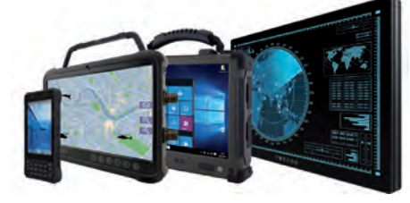
Defense Computing (MIL-STD) für missionskritische Bereiche