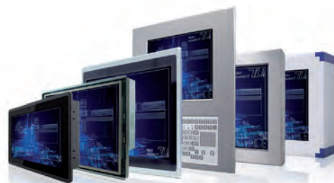
Panel-PC Einbau-Systeme, VESA-Montage, mit Bedienfront, gekapselt