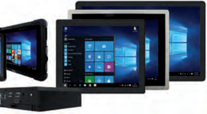
ATEX-zertifizierte Lösungen für extreme Umgebungen