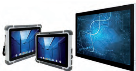
Medizinische Hardware, zertifiziert für das Gesundheitswesen